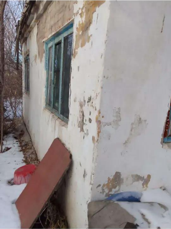
Фото №1. фото сада