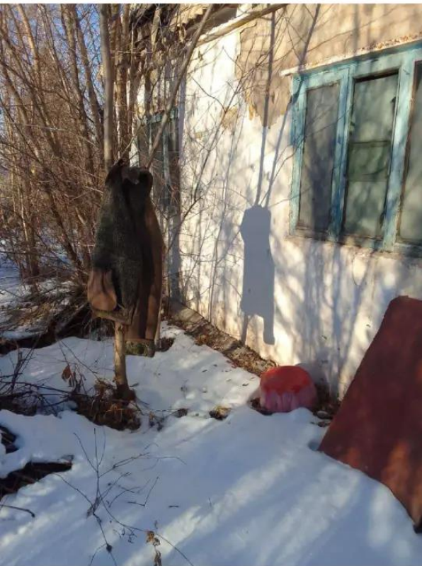
Фото №3. фото