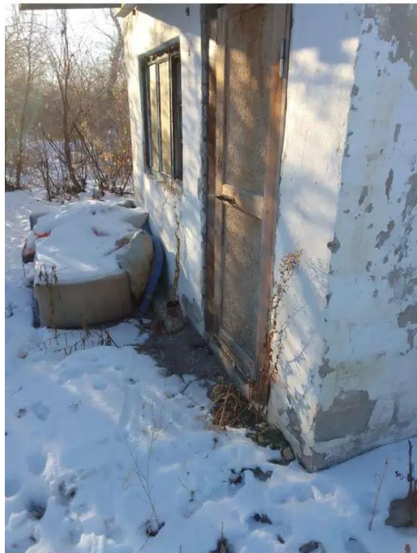
Фото №4. фото