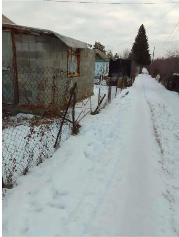
Фото №2. фото сада